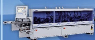
Plnoautomatická olepovačka hrán HIGH FLEX 1440

Uvedené stroje Vám radi predstavíme na veľtrhu LIGNUMEXPO & LES, v dňoch 2. - 5. 10. 2012 na výstavisku Agrokomplex v Nitre v hale B