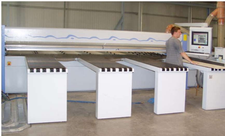
Nárezové centrum vytvára požadované rozmery na štyroch pracovných stoch