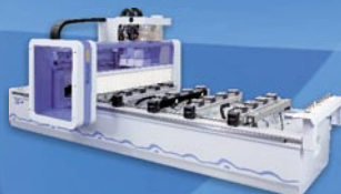
CNC obrábacie centrum VENTURE 109