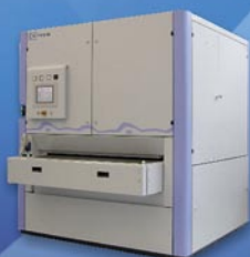
Širokopásová brúska SKO 213/RC