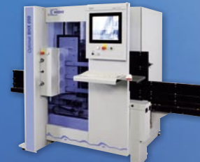
Vertikálne CNC obrábacie centrum BHX 050