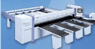
CNC nárezová píla HPP 350