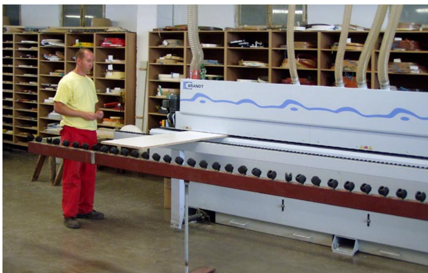
Olepovačka BRANDT výrobný proces nespomaľuje!

Výrobný areál je v priamej línii rozdelený na automatický sklad BARGSTEDT bez obsluhy, strojovú dielňu s uzlami HOLZMA, WEEKE, BRANDT. Hotové dielce potom prechádzajú s presne označenými štítkami zákazky do skladu a do montážnej dielne. Pri nárezovom centre pracuje jeden pracovník: dohliada na kontrolu operácií, odoberanie dielcov pre ďalšie opracovanie. Každý