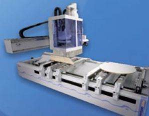
Päťosé CNC obrábacie centrum s olepovacím agregátom VENTURE 20